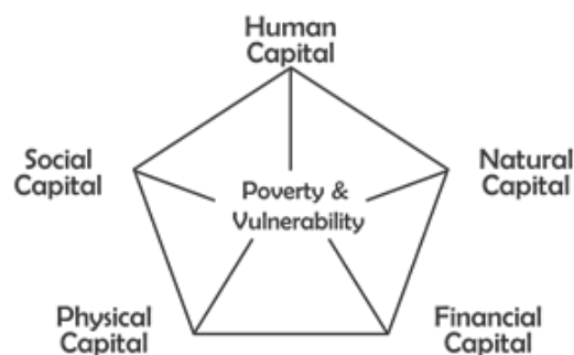
Figura 6: El Marco de los medios de vida sostenibles

En algunos contextos, los ODS proporcionarán un marco útil para debatir y definir el bienestar, así como para elaborar los indicadores y procesos para medirlo. En otros contextos, los usuarios del Marco pueden optar por no utilizar los ODS como referencia para el bienestar local. Un marco alternativo para discutir el bienestar comunitario de manera holística es el Marco de los medios de vida sostenibles. Elaborado por el Fondo Internacional de Desarrollo Agrícola (una agencia de la ONU), el Marco de los medios de vida sostenibles se utiliza en todo el mundo para comprender la complejidad de los temas relacionados con la forma de evaluar y abordar la pobreza y la vulnerabilidad. Este marco identifica cinco tipos de activos o capitales sobre los que se construyen los medios de vida. (Vea la figura 6).