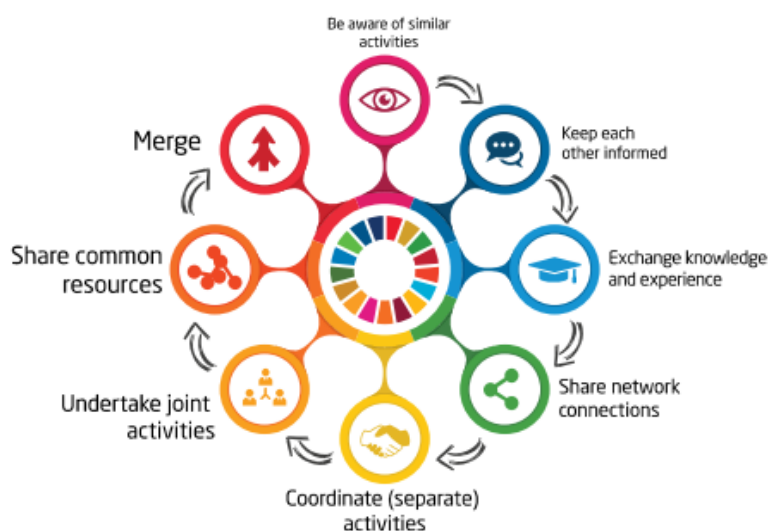
Figura 5: Mayores niveles de interconexión y potencial de creación de valor.

Respecto a las asociaciones, el objetivo 17 de los ODS plantea lo siguiente: "Fortalecer los medios de implementación y revitalizar la Alianza Mundial para el Desarrollo Sostenible", con lo que se reconoce que la colaboración es una parte esencial del desarrollo sostenible. El Marco BZH describe un proceso que requiere la colaboración de las principales partes interesadas en el bienestar comunitario y proporciona datos para respaldar su medición. Las partes interesadas pueden colaborar mediante una gama de opciones. Vea la Figura 5.