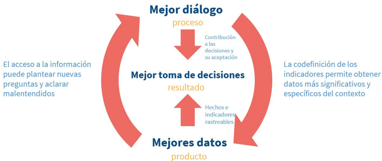
Figura 2: El Marco promueve un mejor diálogo, lo que a su vez permite obtener mejores datos. Ambas contribuciones pueden orientar una mejor toma de decisiones

El Marco también puede conducir a una mejor toma de decisiones relacionadas con los resultados del desarrollo. Las partes interesadas que participan en el Marco CommWell pueden obtener importantes conocimientos y establecer relaciones más sólidas a lo largo del proceso. Esto puede conducir a una toma de decisiones más alineada e informada en relación con el desarrollo en general, así como específicamente sobre cómo se gestionan los impactos de la actividad minera y se comparten los beneficios. El Marco también puede apoyar las decisiones relacionadas con la manera en que se comparte la información y el modo en que las partes interesadas se involucran entre sí.