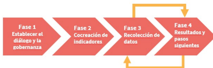
Figura 1: Las cuatro fases del Marco CommWell.

El Marco se divide en cuatro fases y está diseñado para complementar las iniciativas existentes de recolección de datos de referencia en el contexto minero (como las Evaluaciones de Impacto Social), así como los procesos de planificación y desarrollo comunitario existentes. Las cuatro fases del proceso son precedidas por una fase inicial de planificación previa diseñada para las empresas mineras. En el documento de orientación se explican las diferentes fases del Marco.