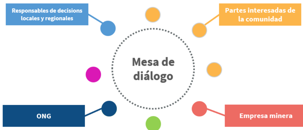
Figura 4: Mesa de diálogo de las partes interesadas